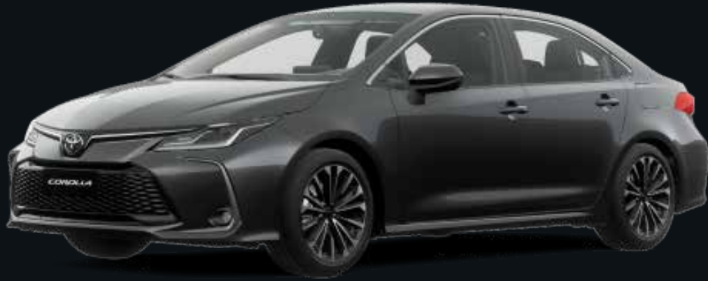
Gris Metálico (1G3)