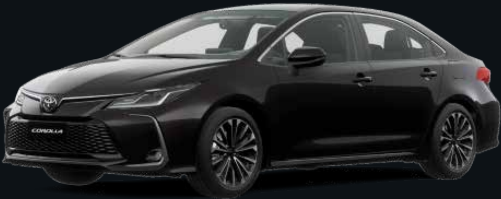
Negro Mica (209)