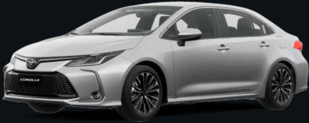
Plata Metalizado (1E7)