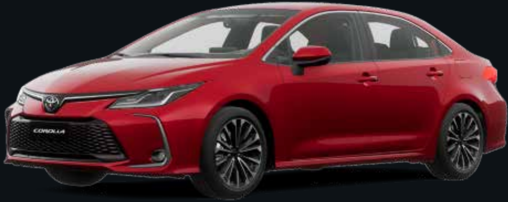
Rojo Mica Metálico (3R3)

Toyota de Venezuela, C.A se reserva el derecho de efectuar cambios sobre los materiales, equipos y especificaciones de sus vehículos sin previo aviso ni ninguna otra obligación. Las imágenes que se puedan mostrar son estrictamente referenciales.