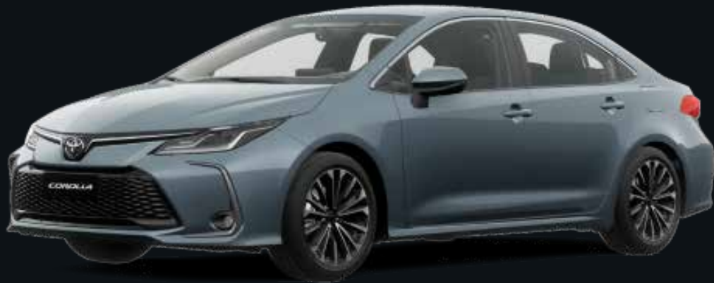
Gris Azulado (1K3)