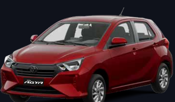
R79 ROJO MICA METÁLICO