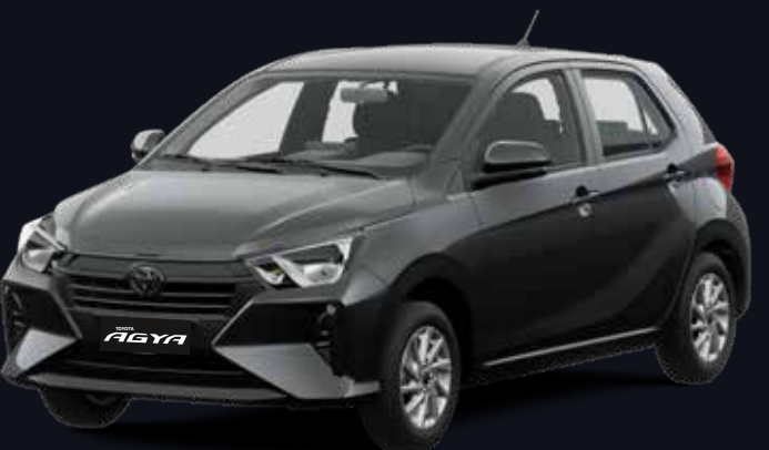
1G3 GRIS METÁLICO