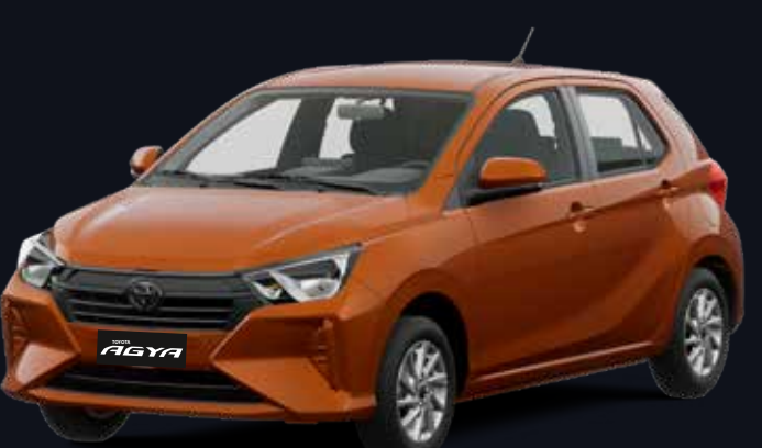
R80 NARANJA METÁLICO