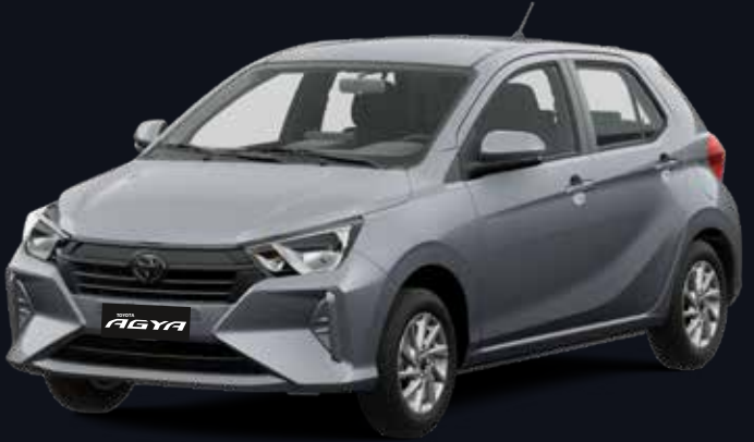
S28 PLATEADO METÁLICO