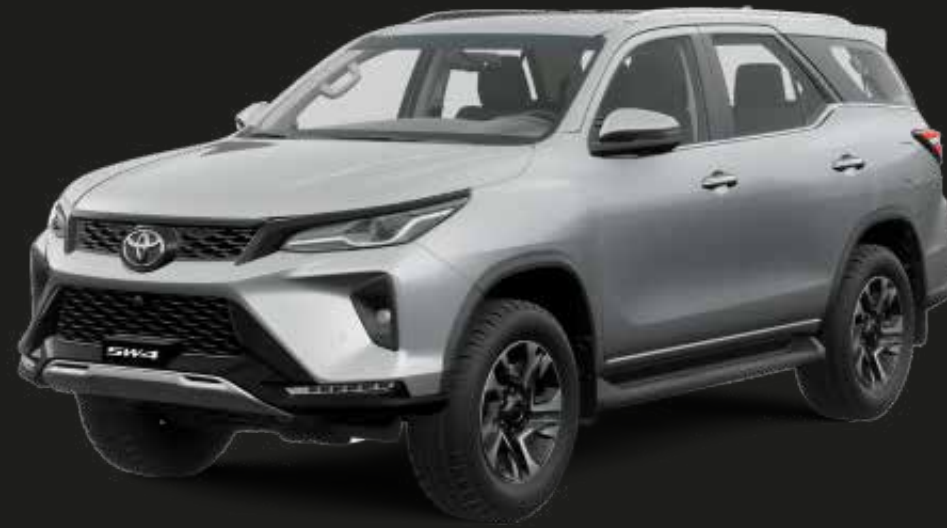
Plata Metalizado (1D6)