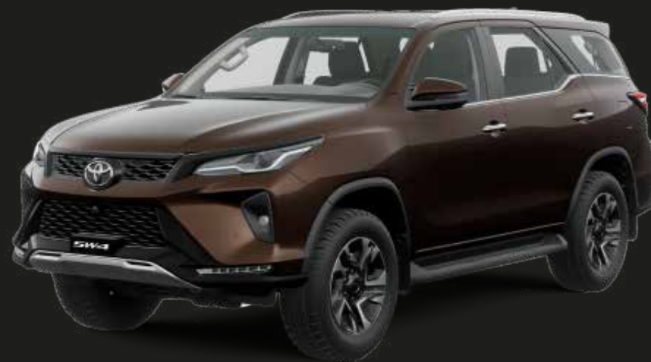
Marrón Café (4W9)