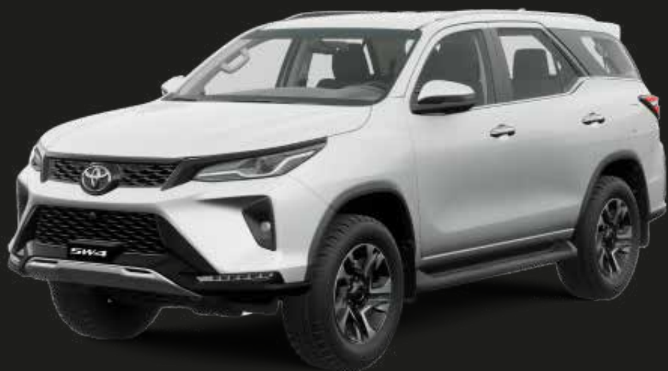
Blanco Perlado (089)