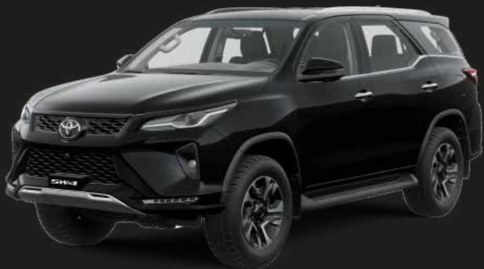
Negro Actitud (218)