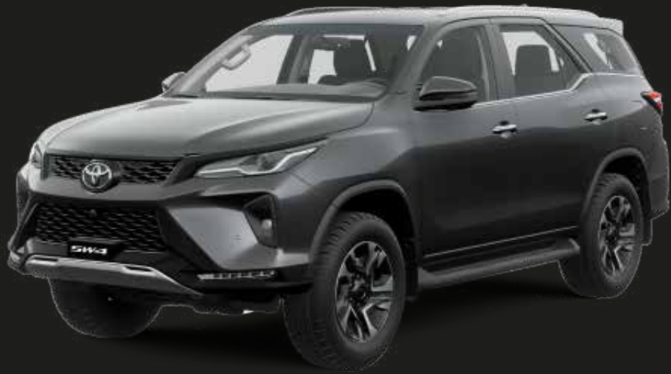
Gris Metálico (1G3)