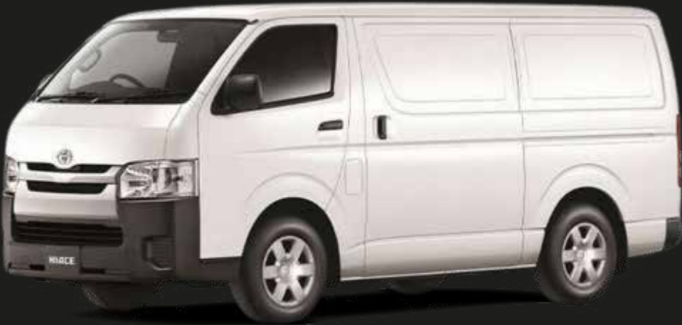
Super Blanco II (040)