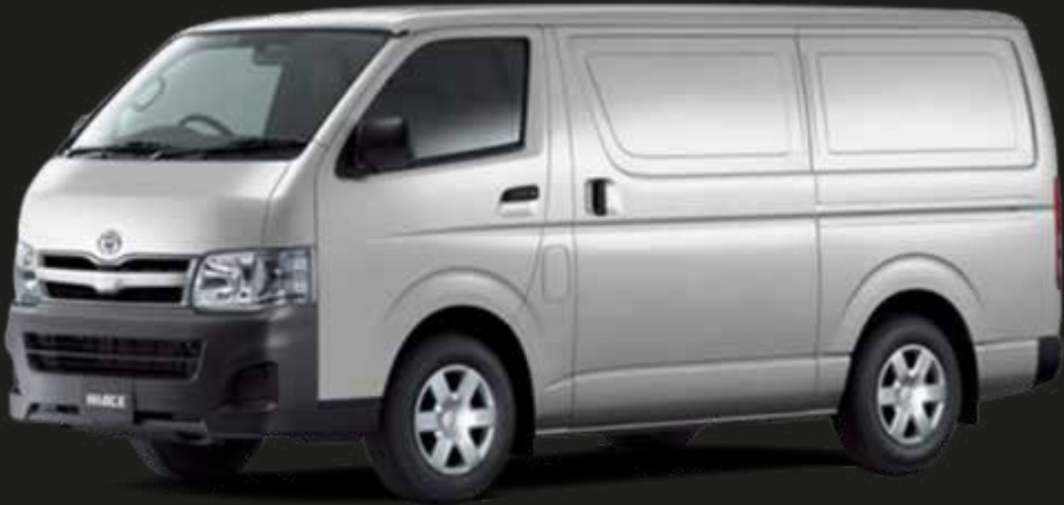
Plata Metalizado (1D6)