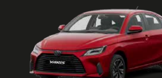
Rojo Mica Metálico (3R3)