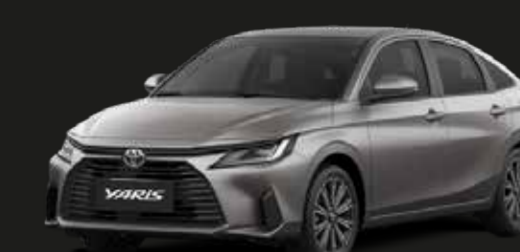
Plateado Eléctrico Metálico (1G3)