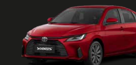
Rojo Mica Metálico (3R3)