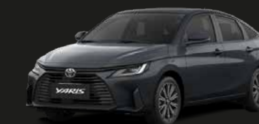
Gris Metálico (S44)