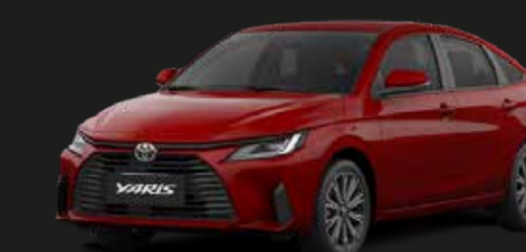
Escarlata Metálico (R77)