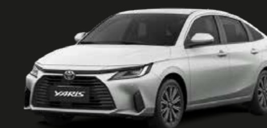
Blanco Perlado Platino (089)