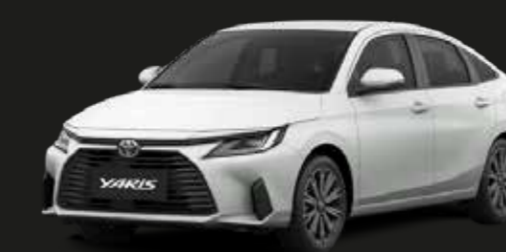
Super Blanco II (040)