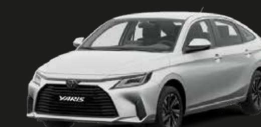
Blanco Perlado Platino (089)