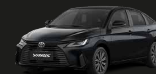
Negro Mica (218)