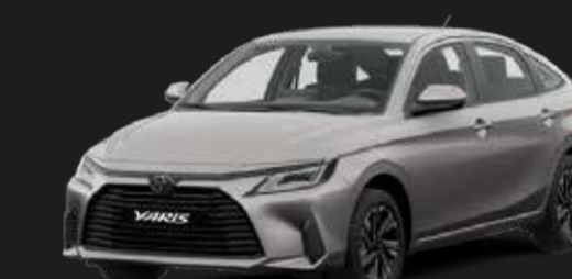
Plateado Eléctrico Metálico (1G3)