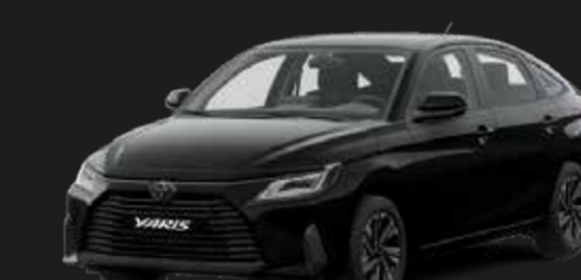
Negro Mica (218)