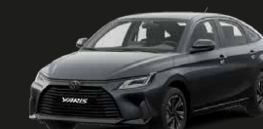
Gris Metálico (S44)