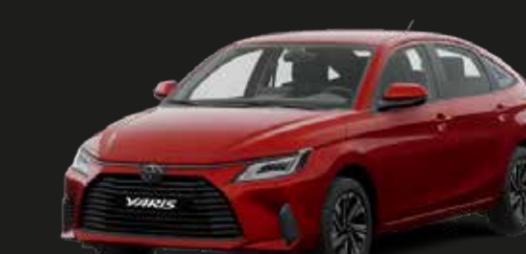
Escarlata Metálico (R77)