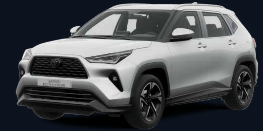
Blanco Perlado (089)