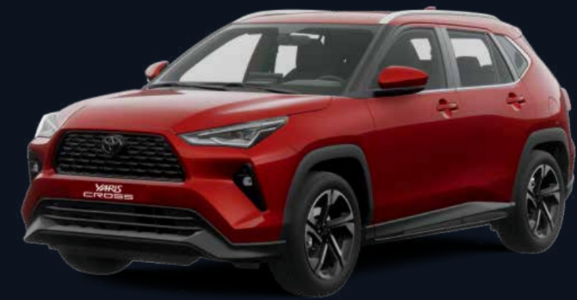
Escarlata Metálico (R77)