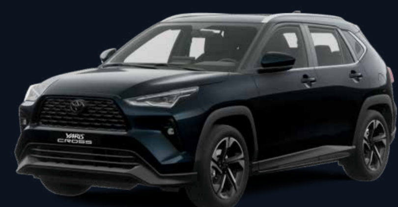
Turquesa Oscuro Metálico (B88)