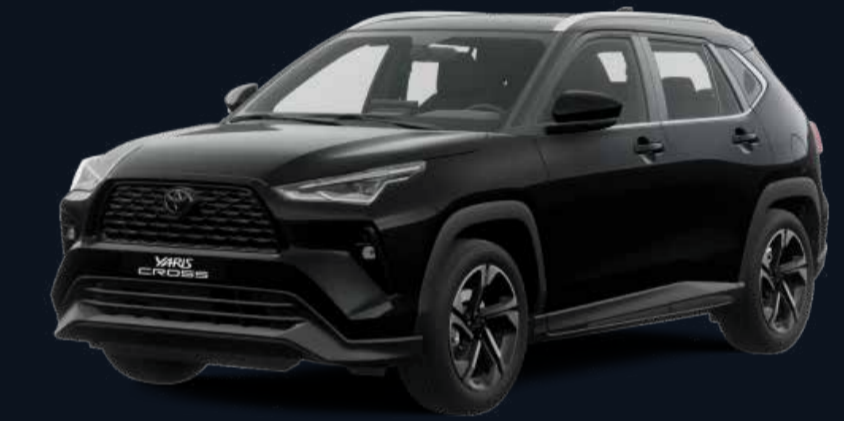
Negro Actitud Metálico (218)