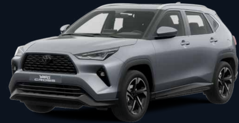
Plata Metalizado (S28)