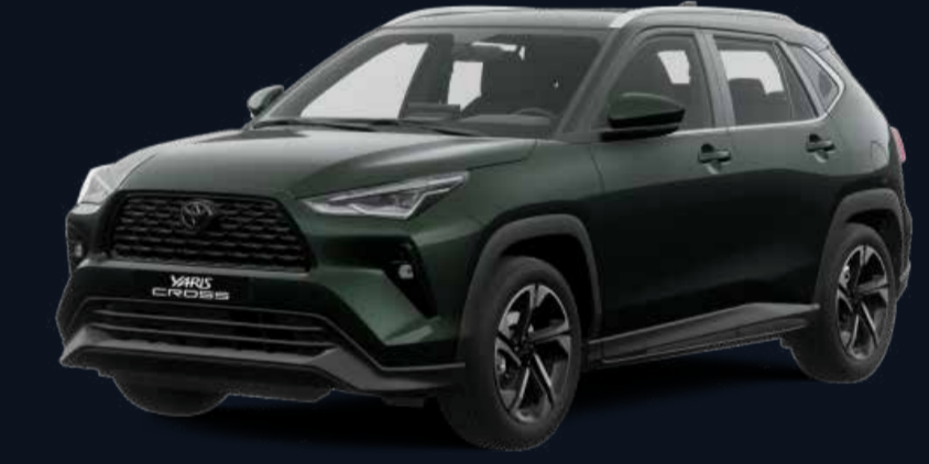
Gris Oliva Metálico (218)