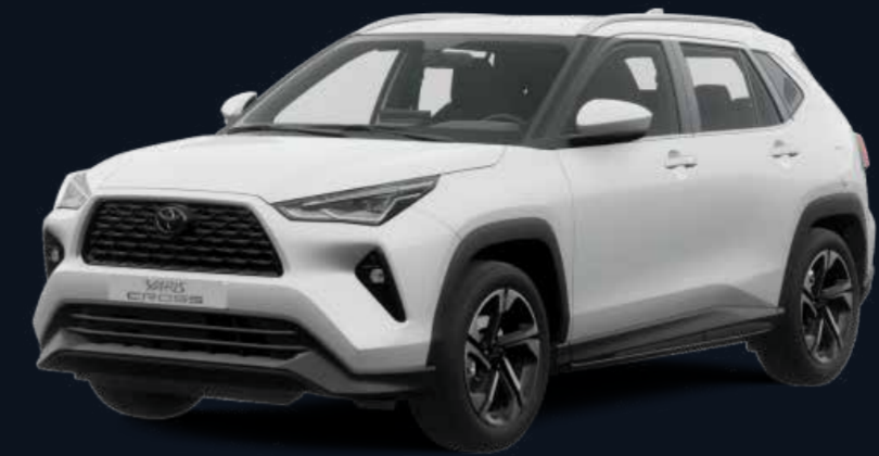
Super Blanco II (040)