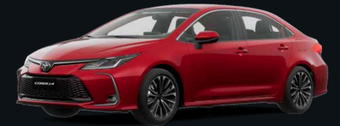
Rojo Mica Metálico (3R3)

Toyota de Venezuela, C.A se reserva el derecho de efectuar cambios sobre los materiales, equipos y especificaciones de sus vehículos sin previo aviso ni ninguna otra obligación. Las imágenes que se puedan mostrar son estrictamente referenciales.