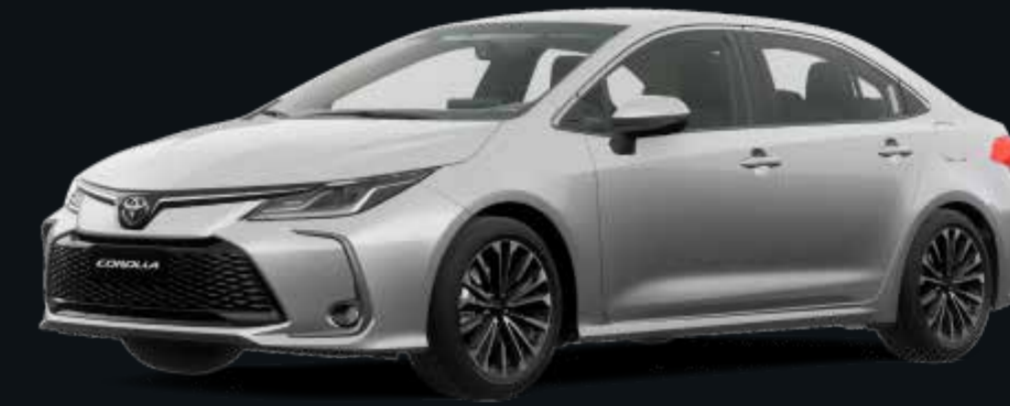
Plata Metalizado (1E7)