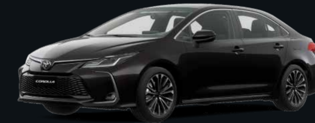
Negro Mica (209)